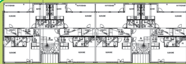
Talo 1 Hus 1