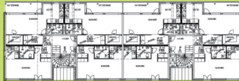
Talo 3 Hus 3